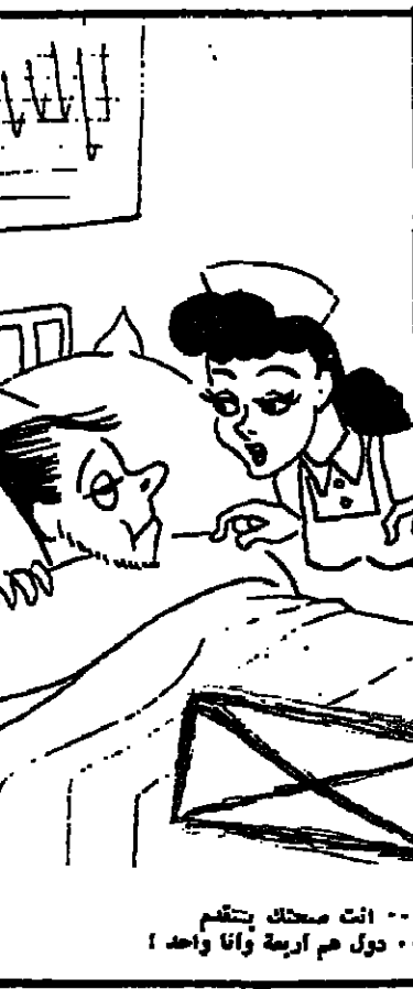
المعرفة: شذ جيك... انت صحتك يتكلم الرضى: من سكن... دول هم اربعة واذا واحد! للمحلاج...

الحب الذي تراه في عيني والوصيت المقدس امام كل شئ تحكيها... والظوق الذي يدعني لترك كل يوم... كل هذه الاحاسيس ليست لك... ان اكتب عليك... الانثى التي تراها اميك... انما هي التي تقتر في عينيها عن الحب... ليست لك ولن تكون... فانت لست الا الورقة الاخضر الحبيب لم يات... وحب لم يتحقق... وحلم ما زلت اعيشه حتى في صمتي ولا مبالائي... يوم التفتيت... شعرت بشيء يشدني اليك... يدعمني لان اوقظ الحب في تفتي... وجيك كنتسي